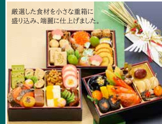
[G] 金千華(きんせんか) 生おせち 和風三段重 重箱サイズ(外寸) 137×196×53mm

当店通常価格21,800円(税別) 12/3迄の早割価格 20,710円 (税込価格)22,367円