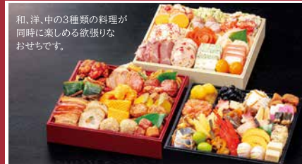
[B] 笑門来福(しょうもんらいふく) 玉清生おせち 和洋中三段重 重箱サイズ(外寸) 228×228×56mm

当店通常価格9,500円(税別) 12/3迄の早割価格 9,025円 (税込価格)9,747円