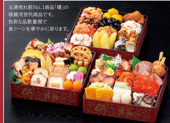
[A] 恵比寿(えびす) 玉清生おせち 和風三段重 重箱サイズ(外寸) 198×198×65mm

当店通常価格12,900円(税別) 12/3迄の早割価格 12,255円 (税込価格)13,236円