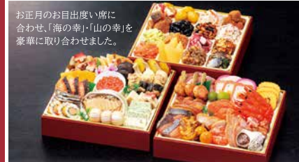
[C] 宝華(ほうか) 玉清生おせち 和洋中三段重 重箱サイズ(外寸) 240×240×55mm

当店通常価格18,500円(税別) 12/3迄の早割価格 17,575円 (税込価格)18,981円