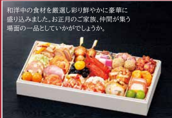
[F] 新春オードブル 玉清生おせち 和洋中一段重 重箱サイズ(外寸) 196×380×62mm

当店通常価格10,800円(税別) 12/3迄の早割価格 10,260円 (税込価格)11,081円