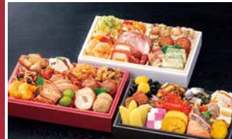
[E] 吉祥(きっしょう) 玉清生おせち 和洋中三段重 重箱サイズ(外寸) 168×257×45mm

当店通常価格25,000円(税別) 12/3迄の早割価格 23,750円 (税込価格)25,650円