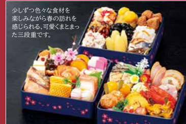
[D] 迎春(げいしゅん) 玉清生おせち 和洋三段重 重箱サイズ(外寸) 165×165×50mm

当店通常価格12,900円(税別) 12/3迄の早割価格 12,255円 (税込価格)13,236円